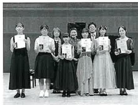
(写真) 前回の安芸高田地区より